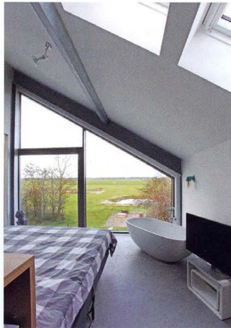
Wakker worden met een view