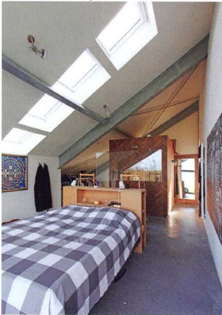
Slaapkamer met open badkamer, gescheiden door een glazen wand.