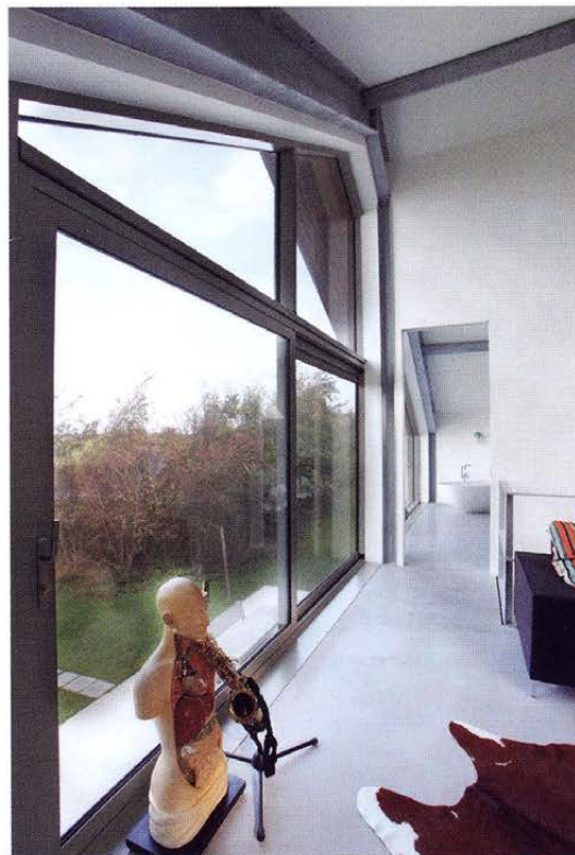
Open ruimtes, naar wens van de bewoner.

Grote overspanningen waarbij de constructie doorgaans zichtbaar blijft (dit kan ook in hout) en waardoor het een industriële en ruimtelijke look krijgt. Door de WoonSchoor aan te passen aan persoonlijke voorkeuren kunnen ook andere sferen worden gecreëerd. Deze WoonSchoor heeft een industriële sfeer, maar je kunt ook kiezen voor bijvoorbeeld een wit interieur, warme houten spanten, houten vloeren maar ook een compleet gladde binnen afwerking (geen spanten in het zicht) behoort tot de mogelijkheden. Wij zijn pas content als de bewoners blij en tevreden zijn", besluiten Yvonne en Sandra.